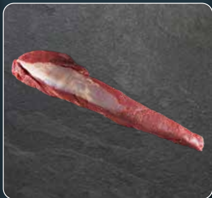
FILET AT von der Kalbin