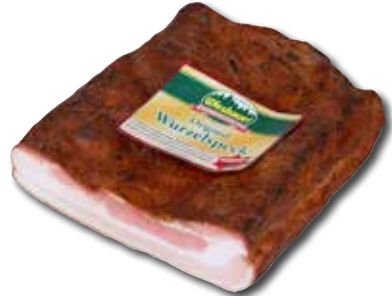
WURZELSPECK PLATTE Aktionspreis pro 100 g € 2,19