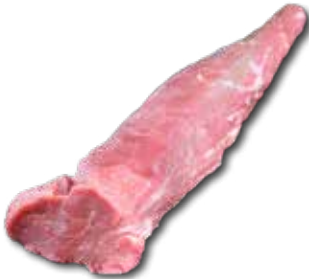
FILET Aktionspreis pro 100 g vom Duroc Schwein € 1,99