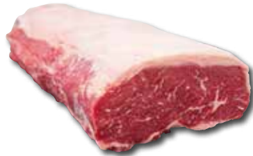
BEIRIED Aktionspreis pro 100 g von der Kalbin € 4,79